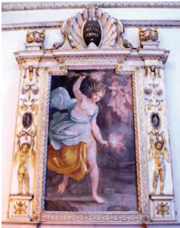
Fig. 2 Ludovico Carracci, Cerere alla ricerca di Proserpina , affresco, Bologna, palazzo Sampieri-Talon, prima sala.

L'ultima opera del ciclo, l' Ercole e Caco (fig. 13) sul camino della terza stanza, ha posto il maggior numero di interrogativi circa il suo autore. Malaguzzi Valeri l'ha assegnato erroneamente a Ludovico, 9 mentre l'attribuzione ad Annibale è di Jaffé, supportata dal confronto con un disegno preparatorio per la figura del ladrone Caco. 10 Cammarota riferisce l'affresco ad Agostino 11 e infine Catherine Loisel propone quella che appare la soluzione più convincente, ipotizzando la collaborazione dei due fratelli, Agostino e Annibale. La figura di Ercole sarebbe stata messa a punto da Agostino, e ne sarebbero prova in particolare gli studi a penna su un foglio del Rijksmuseum di Amsterdam (figg. 14-15); la figura di Caco sarebbe opera di Annibale, come testimonierebbe un disegno del Metropolitan Museum of Art di New York (fig. 16). L'affresco sarebbe stato in gran parte eseguito da Annibale, consegnando