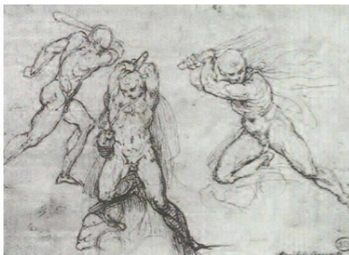
Fig. 14 Agostino Carracci, Studi per la figura di Ercole , penna e inchiostro bruno, Amsterdam, Rijksmuseum (recto del seguente).

In primo luogo va sottolineato il doppio motivo della discesa/ascesa agli e dagli Inferi: nella volta della prima stanza è raffigurato Ercole che, dopo la morte, risale dall'Ade nell'Olimpo, mentre sul camino Cerere discende alla ricerca di Proserpina, che ritornerà in superficie. Giove è colui che decide, in entrambi i casi. Il passaggio è dal buio alla luce, dalla morte alla redenzione: si tratta di un importante tema morale, dalla connotazione religiosa, che ben si accorda con la committenza di un abate.