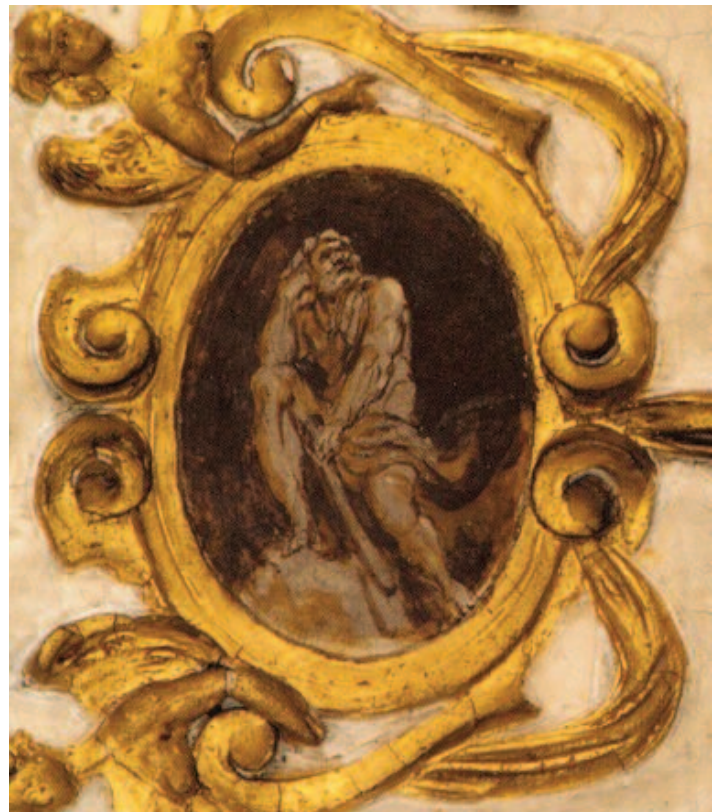
Fig. 10 Annibale Carracci, Ercole a riposo , affresco, Bologna, palazzo Sampier-Talon, seconda sala.