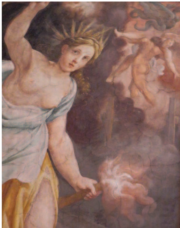
Fig. 3 Ludovico Carracci, Cerere alla ricerca di Proserpina , particolare