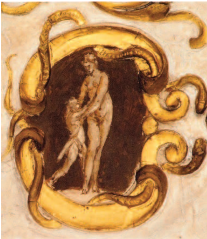
Fig. 9 Annibale Carracci, Venere con amorino , affresco, Bologna, palazzo Sampier-Talon, seconda sala.

Nel contempo Cerere, ignara di tutto, è tormentata in sogno da funesti presagi di separazione e di morte e, nella veglia, da una visione di Proserpina che si lamenta e le chiede di riportarla alla luce. Terrorizzata, fa ritorno in Sicilia dove scopre che sua figlia è scomparsa; vi trova Elettra, che le racconta di come Proserpina sia stata convinta da Venere a uscire per poi sparire al passaggio di un carro che portava con sé la notte. Cerere si reca sull'Olimpo dove insulta Venere, responsabile dell'inganno ai danni di Proserpina, e gli dèi, che non rispon-