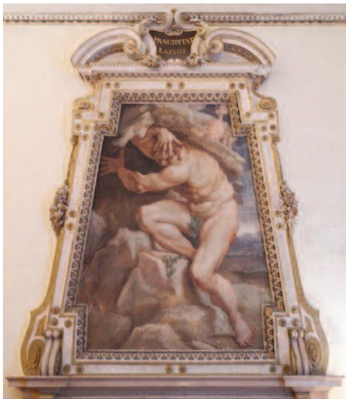
Fig. 11 Agostino Carracci, Encelado travolto , affresco, Bologna, palazzo Sampieri-Talon, seconda sala.

dai duri monti / e dalla selva che spesso seguì il richiamo della lira bistonica. / Ma dopo che l'Alcide, inviato dall'Inachia Argo, / toccò i campi della Tracia col pacifero piede / e sovvertì le terribili mangiatoie del sanguinario re / e nutrì i cavalli di Diomede, / allora, allietato dal momento felice per la patria, il vate / riprese le melodiose corde della disavvezza lira / e, facendole vibrare grazie al levigato plectro, / con pollice festoso guidò l'insigne avorio. / [...] / Orfeo cantava la persecuzione della matrigna e le imprese / di Ercole e i mostri sottomessi dalla sua forte mano; / cantava come Ercole avesse mostrato all'impaurita madre i serpenti schiacciati / e, intrepido bambino, avesse riso con fierezza: / "Non ti atterri il toro che coi muggiti faceva tremare le città / dittee né la rabbia del cane stigio, / non il leone che sarebbe ritornato allo stellato asse del cielo, / non il cinghiale che rese celebre il nome Erimanto. / Tu sciogli le cinte delle Amazzoni, assali gli uccelli stinfalidi / con l'arco, da Occidente conduci le greggi / e abbatti i numerosi arti del condottiero tricorpore / e da un unico nemico tante volte ritorni vincitore. / Ad Anteo non giovò cadere, né all'Idra crescere, / né i veloci piedi sottrassero