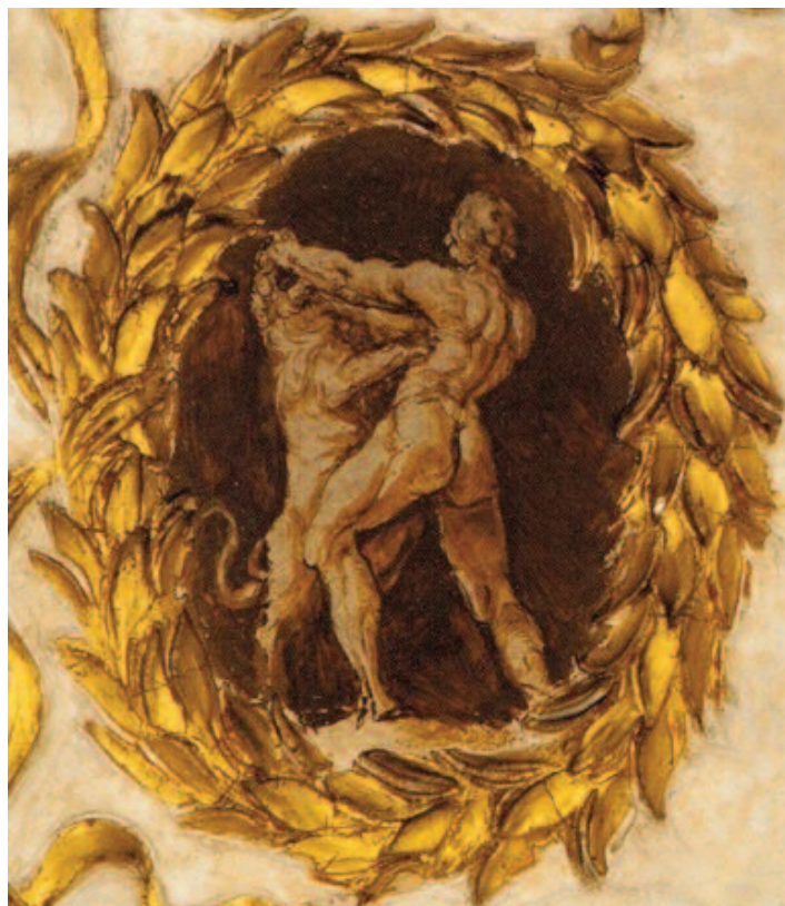
Fig. 8 Annibale Carracci, Ercole e il leone di Nemea , affresco, Bologna, palazzo Sampieri-Talon, seconda sala.