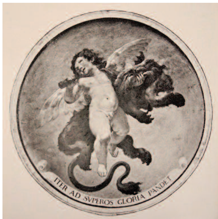
Fig. 18 Guercino (?), Ercole fanciullo , affresco, Bologna, palazzo Sampieri-Talon, distrutto nel 1876 (da F. Malaguzzi Valeri, La giovinezza di Ludovico Carracci , “Cronache d'arte” I, 1, 1924).

Nell'ulteriore stanza, della quale non si hanno notizie certe, era collocato l'affresco che ritraeva un Ercole fanciullo , accompagnato dall'iscrizione ITER AD SUPEROS GLORIA PANDET