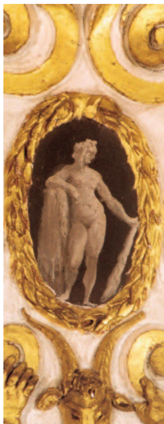
Fig. 5 Ludovico Carracci, Onfale , affresco, Bologna, palazzo Sampieri-Talon, prima sala.