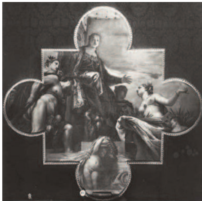
Fig. 20 Paolo Veronese, Venezia riceve l'omaggio di Ercole e Cerere , olio su tela, Venezia, Gallerie dell'Accademia (Fondazione Federico Zeri. Università di Bologna, fototeca).