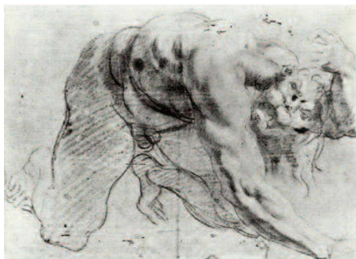
Fig. 16 Annibale Carracci, Studio per la figura di Caco , New York, Metropolitan Museum of Art.

Virgilio narra la storia di un pastore che riposa all'ombra di un albero e che sta per essere morso da un ser-