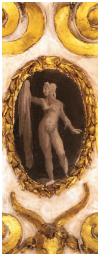
Fig. 4 Ludovico Carracci, Deianira , affresco, Bologna, palazzo Sampieri-Talon, prima sala.

Contestualmente al ciclo di affreschi, Astorre Sampieri commissionò ai Carracci tre tele con episodi della vita di Cristo, Cristo e l'adultera , Cristo e la samaritana e Cristo e la cananea , rispettivamente di Agostino, Annibale e Ludovico, ricordate da più fonti e caratterizzate, al contrario dei dipinti murali, da chiara differenziazione stilistica, pur in una certa uniformità di tono. 13