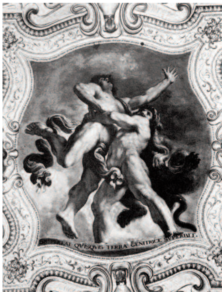
Fig. 17 Guercino, Ercole e Anteo , affresco, Bologna, palazzo Sampieri-Talon, quarta sala.

Sul cammino l' Ercole e Caco è accompagnato da NULLA FUGAM REPERIT FALLACIA, tratta dal IV libro delle Georgiche di Virgilio, al verso 443: