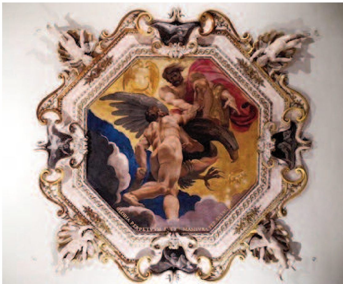
Fig. 1 Ludovico Carracci, Ercole accolto da Giove nell'Olimpo , affresco, Bologna, palazzo Sampieri-Talon, prima sala.

L'affresco del camino ha per protagonista Cerere, rappresentata nella sua discesa agli Inferi alla ricerca di Proserpina, tenendo le fiaccole che l'accompagnano durante il viaggio ( fig. 2 ). Come scena secondaria, verso l'angolo in alto a destra, è mostrato il rapimento di Proserpina ad opera di Plutone ( fig. 3 ). Due obelischi, che segnano l'ingresso all'oltretomba, servono da mediazione tra le due rappresentazioni. L'affresco è incorniciato da una sorta di edicola: della decorazione dei suoi piedritti fanno parte due piccoli ovali dipinti, ancora a grisaille su fondo nero, raffiguranti Deianira e Onfale , la prima con la letale camicia di Nesso, la seconda con i due principali attributi di Ercole, la clava e la pelle del leone nemeo ( figg. 4-5 ).