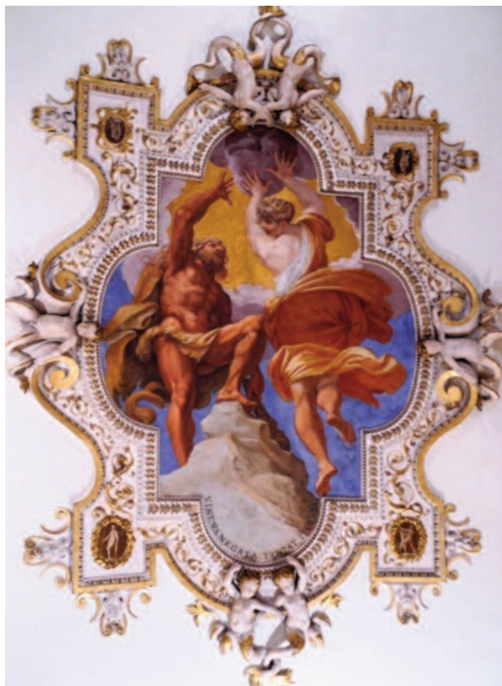
Fig. 6 Annibale Carracci, La Virtù dischiude a Ercole la via del cielo , affresco, Bologna, palazzo Sampieri-Talon, seconda sala.

Un ordine contrario al naturale percorso cui si è obbligati entrando nella prima sala dall'ingresso ufficiale, a meno di supporre che nel corso del tempo la configurazione dell'edificio e, dunque, i percorsi siano stati mutati radicalmente e, comunque, in modi oggi non riconoscibili e non immediatamente ricostruibili.