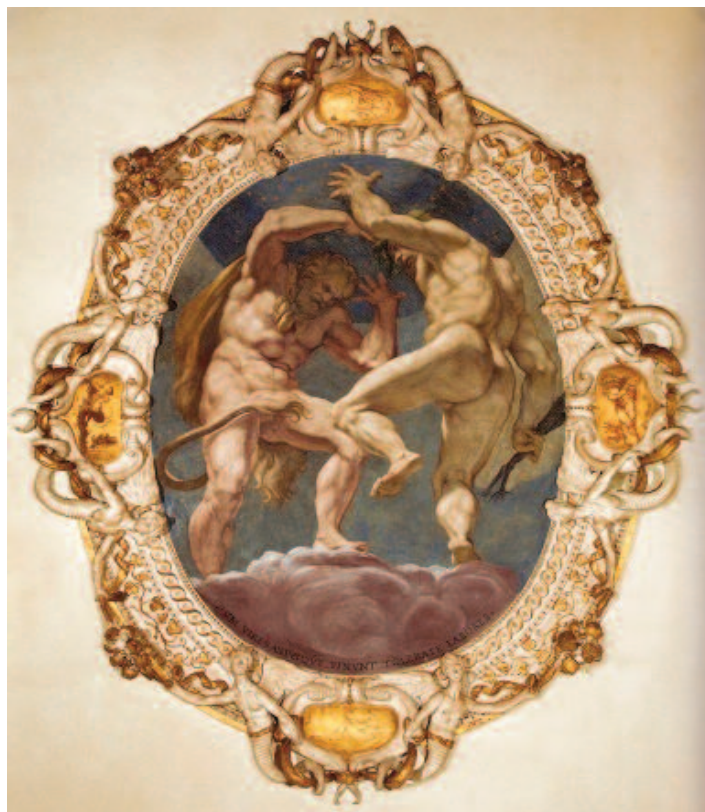
Fig. 12 Agostino Carracci, Ercole aiuta Atlante a sostenere il mondo , affresco, Bologna, palazzo Sampieri-Talon, terza sala.