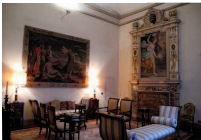
Fig. 19 Palazzo Sampieri-Talon, Bologna, veduta della prima sala.