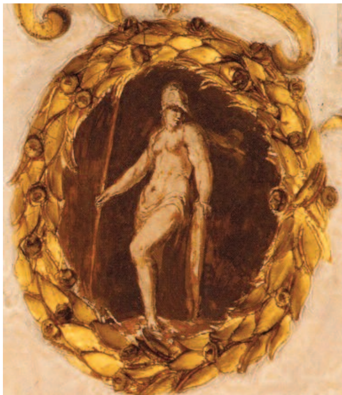
Fig. 7 Annibale Carracci, Athena in armi , affresco, Bologna, palazzo Sampieri-Talon, seconda sala.

Appare tuttavia plausibile un'altra chiave d'interpretazione, maggiormente comprensiva. L'autore che più estesamente ha narrato il mito di Cerere e di sua figlia Proserpina è Claudio Claudiano, il poeta alessandrino molto ammirato dai Romani che compose il De raptu Proserpinae , poema in tre libri rimasto incompiuto, un classico cui fu ridata centralità da Francesco Petrarca e, successivamente, da Poliziano.