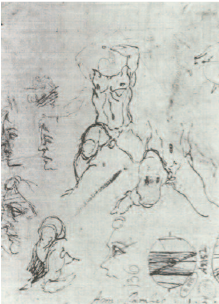
Fig. 15 Agostino Carracci, Studi per la figura di Ercole , penna e inchiostro bruno, Amsterdam, Rijksmuseum (verso del precedente).

Allo stesso modo Cerere porta la luce e le arti agli uomini contrapponendosi a Plutone, che rappresenta la violenza: